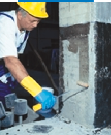
Applicazione di Mapewrap Primer 1