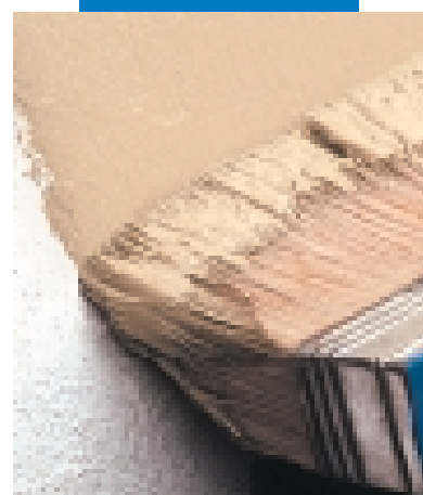
Rivestimento con Elastocolor