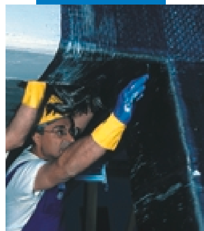
Fasciatura di un nodo