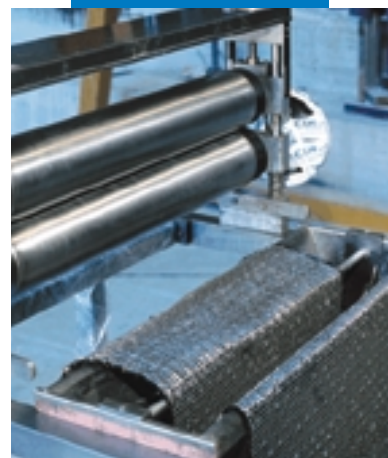
Impregnazione a macchina di Mapewrap C