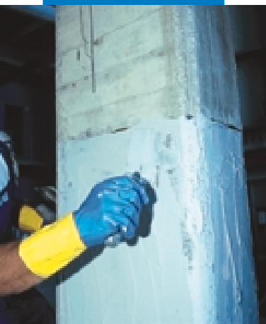
Rasatura con MapeWrap 11 o MapeWrap 12

eseguita in tempi estremamente brevi e spesso senza che sia necessario interrompere l'esercizio della struttura. Rispetto alla tecnica di placcaggio con piastre metalliche (beton plaque), l'uso dei tessuti MapeWrap C Quadri-AX consente di adattarsi a qualsiasi forma dell'elemento da riparare, non necessita di sostegni provvisori durante la posa in opera ed elimina tutti i rischi connessi con la corrosione del rinforzo applicato.