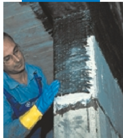
Fasciatura di pilastri e travi