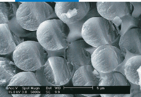
Microfotografia di un composto strutturale a matrice polimerica dal Laboratorio di Ricerca e Sviluppo Mapei

Le indicazioni e le prescrizioni sopra riportate, pur corrispondendo alla nostra migliore esperienza sono da ritenersi, in ogni caso, puramente indicative e dovranno essere confermate da esaurienti applicazioni pratiche; pertanto, prima di adoperare il prodotto, chi intende farne uso è tenuto a stabilire se esso sia o meno adatto all'impiego previsto, e comunque assume ogni responsabilità che possa derivare dal suo uso.