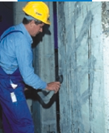
Preparazione del supporto