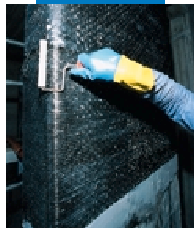
Applicazione della 2ª mano di Mapewrap 31