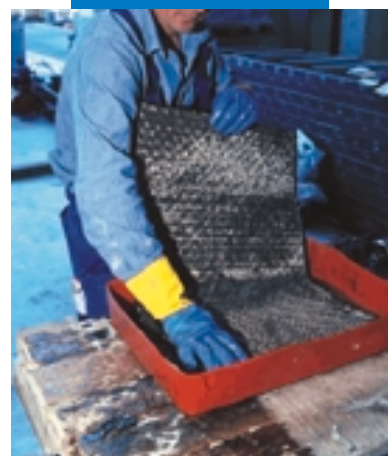
Impregnazione manuale di Mapewrap C